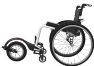
ICON 60 con FreeWheel

Freno tijera horizontal, con opción de freno vertical deportivo