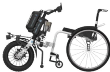
ICON 60 con dispositivo motorizado