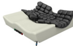
ROHO® Hybrid Select