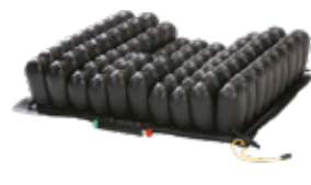
ROHO® CONTOUR SELECT®