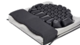
ROHO® HYBRID ELITE® Dual Compartment