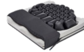
ROHO® Hybrid Elite SR® Single Compartment