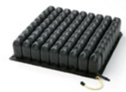
ROHO® Single Compartment