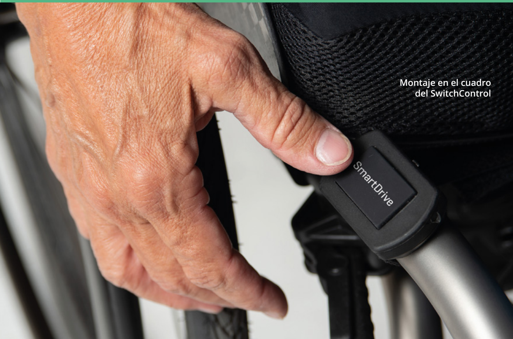
Montaje en el cuadro del SwitchControl

Use cualquier interruptor mono jack externo para operar su SwitchControl, sin necesidad de programación.