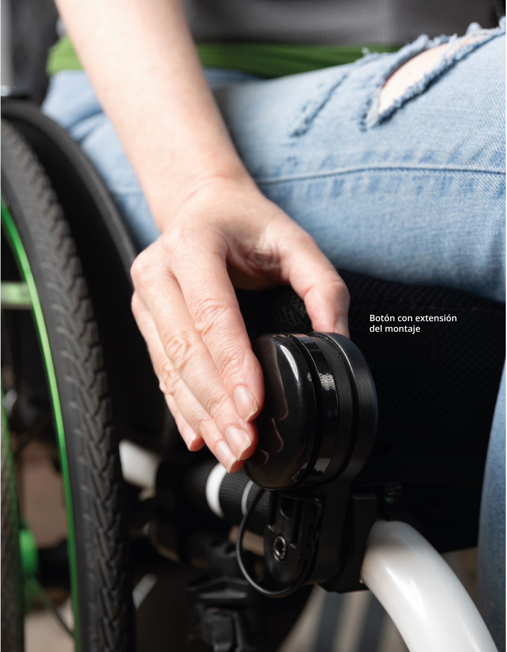
Botón con extensión del montaje