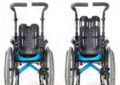
Función de ajuste de altura