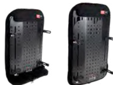
El acolchado se pliega debajo respaldo cuando en el rango de altura más bajo